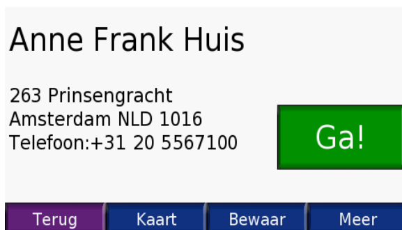
Standaard uitgebreide POI informatie