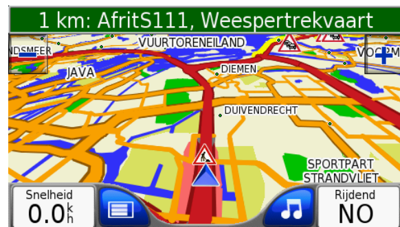
Overzichtelijke TMC verkeersinformatie