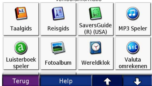
Zeer compleet reispakket