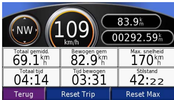
Uitgebreide trip computer